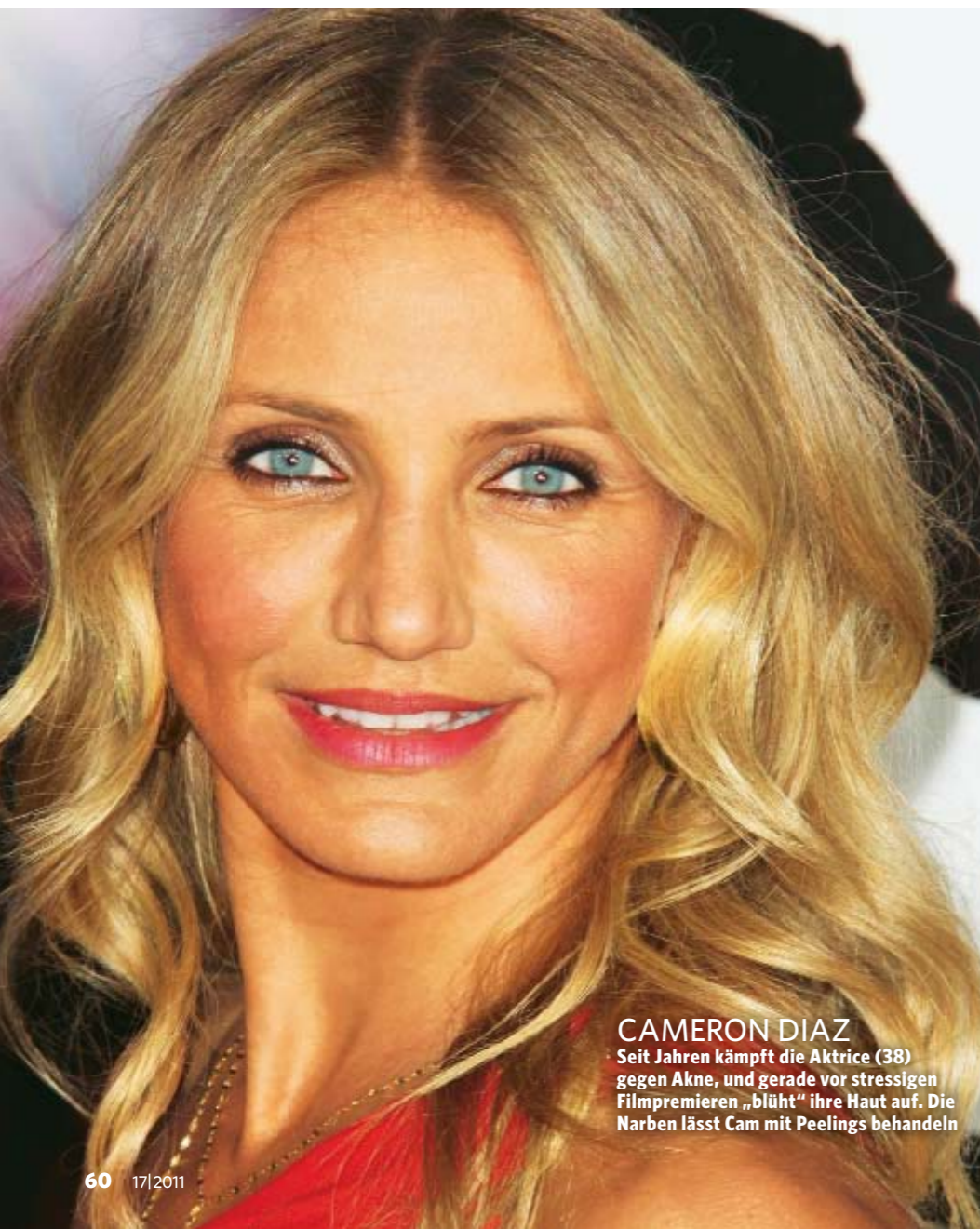
CAMERON DIAZ Seit Jahren kämpft die Aktrice (38) gegen Akne, und gerade vor stressigen Filmpremieren „blüht“ ihre Haut auf. Die Narben lässt Cam mit Peelings behandeln

Was hilft? Die goldene Regel: Finger weg von Pickeln! Nur die Kosmetikerin darf ausreinigen. Gegen Akne wirken Pflegeprodukte mit Zink, Salicylsäure, Liphydroxysäure oder Benzolperoxid. Masken mit Heilerde (z. B. von Luvos) saugen das Hautfett wie ein Schwamm auf und lindern Entzündungen. Die speziellen Anti-Pickel-Produkte gegen Spät-Akne enthalten viele pflegende Inhaltsstoffe, die z. B. auch Fältchen glätten und viel Feuchtigkeit spenden. Beim Dermatologen helfen Fruchtsäure-Peelings. Dafür bereitet man die Haut zwei Wochen mit einer Fruchtsäurecreme vor, dann wird alle zwei Wochen gepeelt. Der Effekt: Pickelmale verblassen, Poren werden verfeinert, und der Teint strahlt rosig.