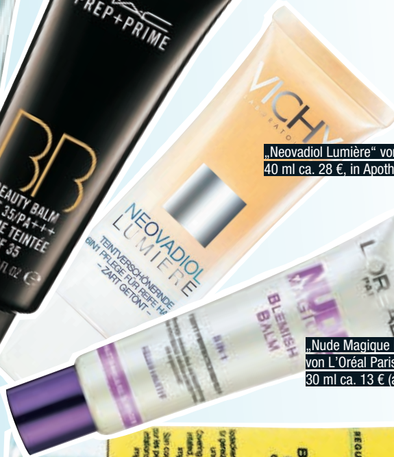
„Nude Magique Blemish Balm“ von L'Oréal Paris, in 3 Nuancen, 30 ml ca. 13 € (ab Mai)