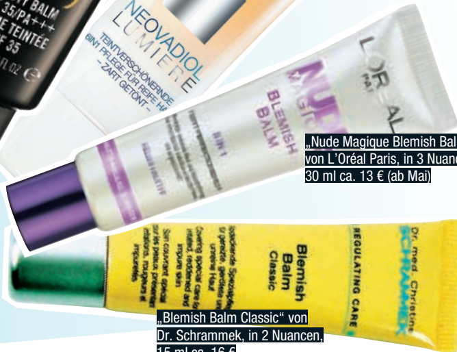
„Blemish Balm Classic“ von Dr. Schrammek, in 2 Nuancen, 15 ml ca. 16 €