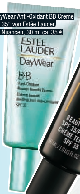
„DayWear Anti-Oxidant BB Creme LSF 35“ von Estée Lauder in 2 Nuancen, 30 ml ca. 35 €