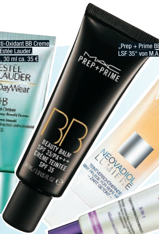
„Prep + Prime BB Beauty Balm LSF 35“ von M.A.C, 30 ml ca. 29 €